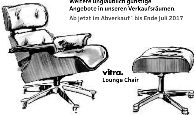
vitra. Lounge Chair

Weitere unglaublich günstige Angebote in unseren Verkaufsräumen. Ab jetzt im Abverkauf* bis Ende Juli 2017